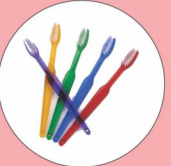
प्लास्टिक दूधब्रश 500 वर्ष