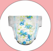
डिस्पोजल डायपर 500 वर्ष