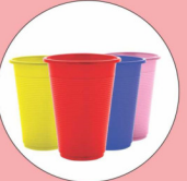
प्लास्टिक कप 450 वर्ष