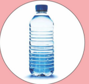
पानी की बोतल 450 वर्ष