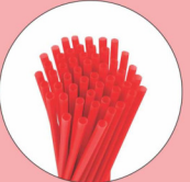
प्लास्टिक स्ट्रॉ 200 वर्ष