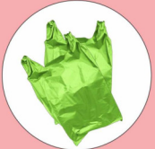
प्लास्टिक बैग 20 वर्ष