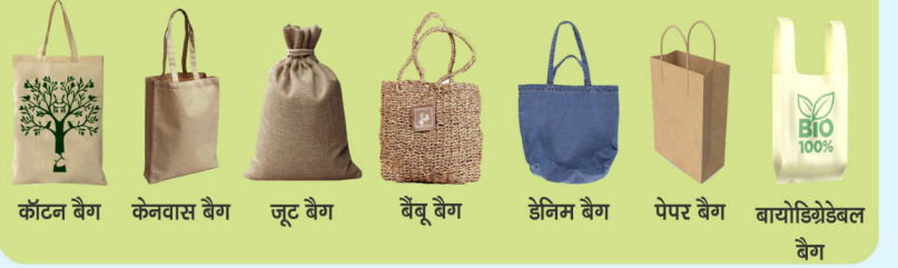
कॉटन बैग केनवास बैग जूट बैग बैबू बैग डेनिम बैग पेपर बैग बायोडिग्रेडेबल बैग