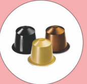
कॉफी पॉड 500 वर्ष