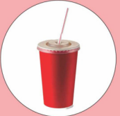
कॉफी कप 30 वर्ष